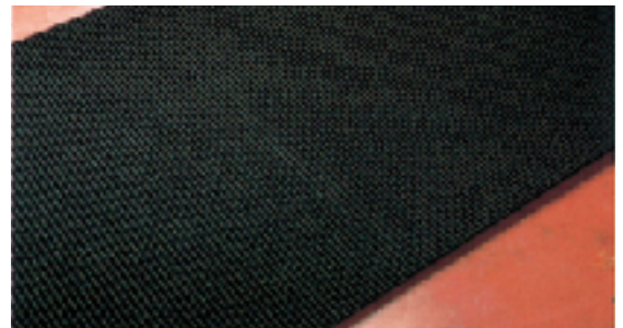
▲パッケージコンベヤベルト