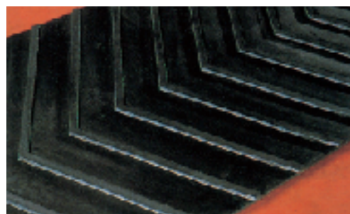
▲中寄棧付コンベヤベルト